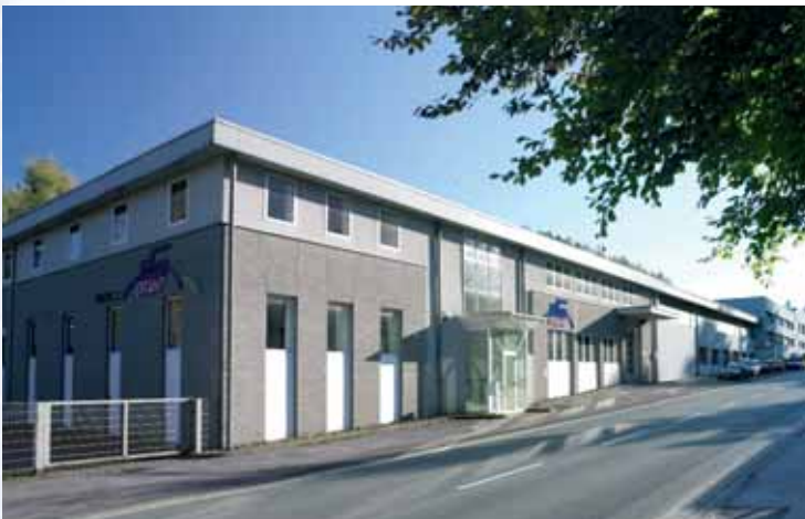
Fabrique Hemer-Ihmert • Facility Hemer-Ihmert

Sociétés / Partenaires commerciales • Subsidiaries / Trading partners