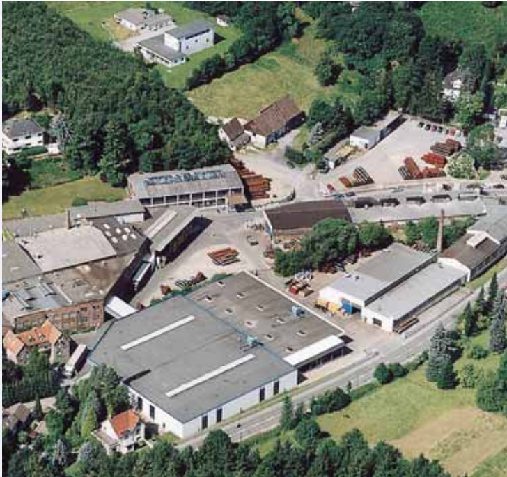
Chef-d'œuvre Hemer-Bredenbruch • Headquarter Hemer-Bredenbruch